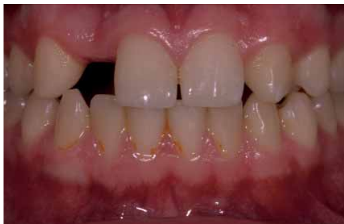
Abb. 1 Ausgangssituation Nichtanlage 12

Wenn man die implantologische Fortbildung etwas kritisch verfolgt, so stellt man ein bisschen den Trend zu immer „größer – weiter – schneller – besser“ fest. Hingegen werden die wirklich wichtigen Punkte einer „ordentlichen“ Implantation eher weniger vermittelt. Den „normalen“ implantologisch tätigen Praktiker interessiert eine von der Behandlungszeit über die Behandlungskosten überschaubare Versorgung für seine Patienten, mit einem guten funktionellen und ästhetischen Langzeitergebnis.