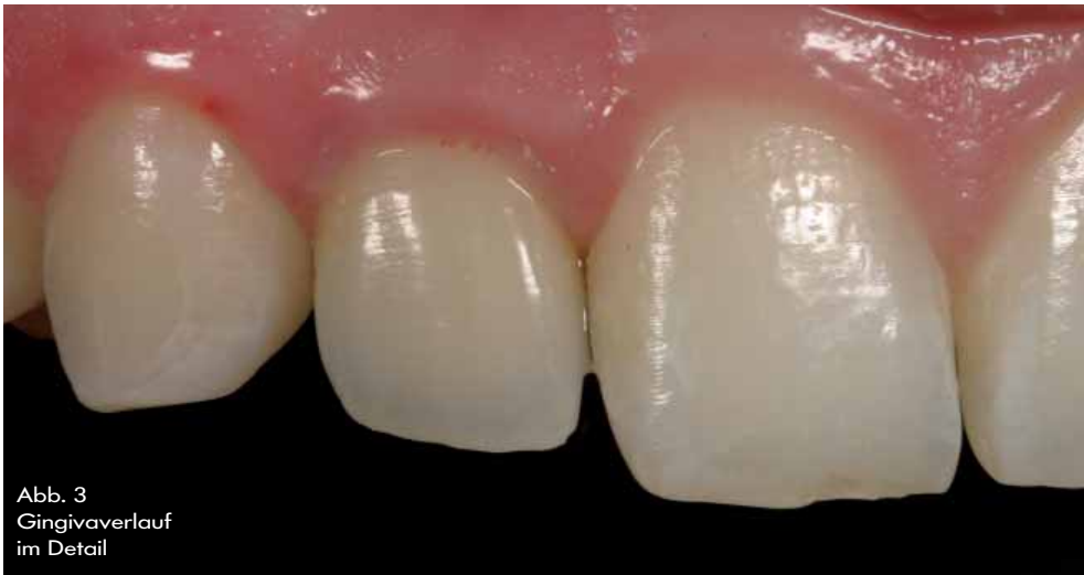
Abb. 3 Gingivaverlauf im Detail